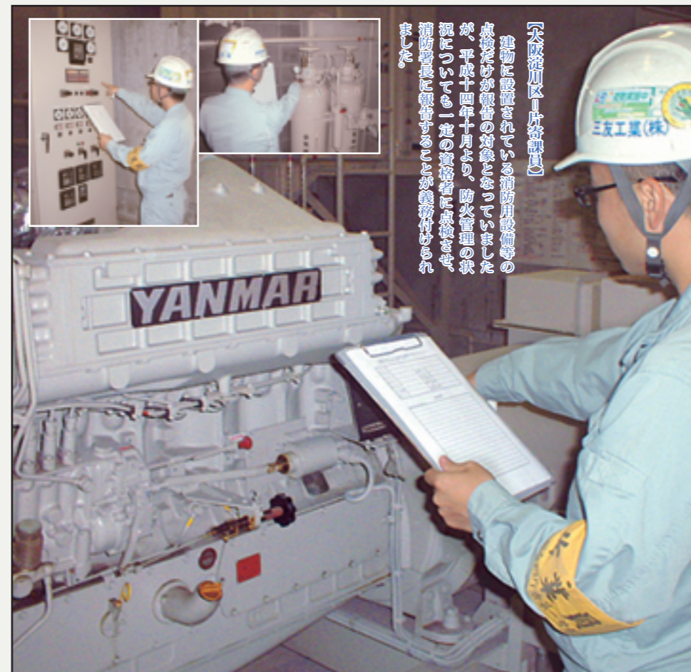
▲消防法の点検項目にしたがって作業をする片寄課員=月刊三友メンテナンス

東京支店 〒108-0014 東京都港区芝4丁目4番10号 TEL:(03)5730-4133 (代表) FAX:(03)3453-3365